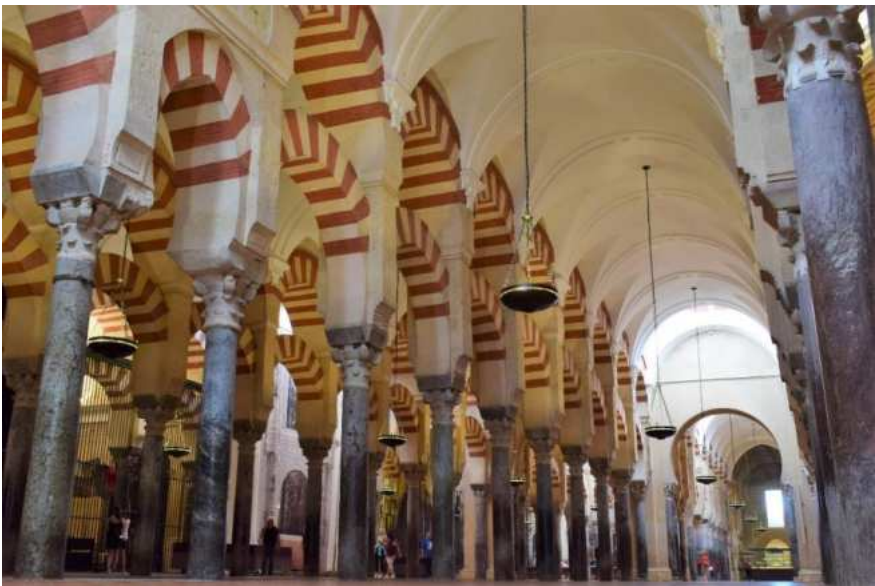
De La Mezquita in Cordoba

Deze editie van ons clubblad, zo kort voor de zomervakantie, vertelt ons weer allerlei wetenswaardigheden met betrekking tot onze TC De Waardrenner. Deze keer een ‘haastklus’ omdat we de afgelopen week terugkwamen van een mooie rondreis door Andalusië.