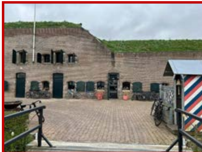
Foto impressie clubrit naar Fort Bakkerskil